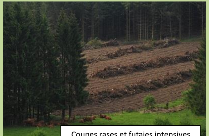
Coupes rases et futaies intensives