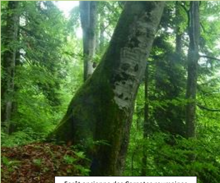
Forêt ancienne des Carpates roumaines

Ainsi, l'ignorance entretenue pendant longtemps sur ces questions ne peut s'assimiler à un blanc seing 1 de la démocratie aux appétits débridés des marchés. Autant nous mettons des enfants au monde, autant nous avons la responsabilité de leur permettre des paysages non dégradés en valeur écologique, autorisant la maturité des arbres, tout comme en qualité de lieux de vie.